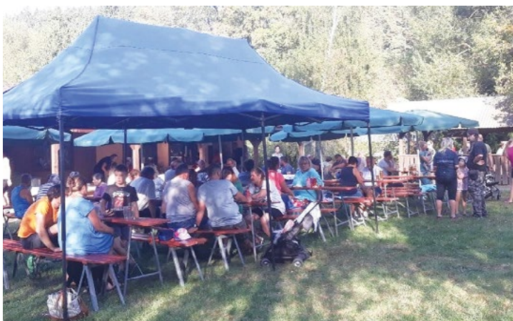
Dětský den – Vojtěchov