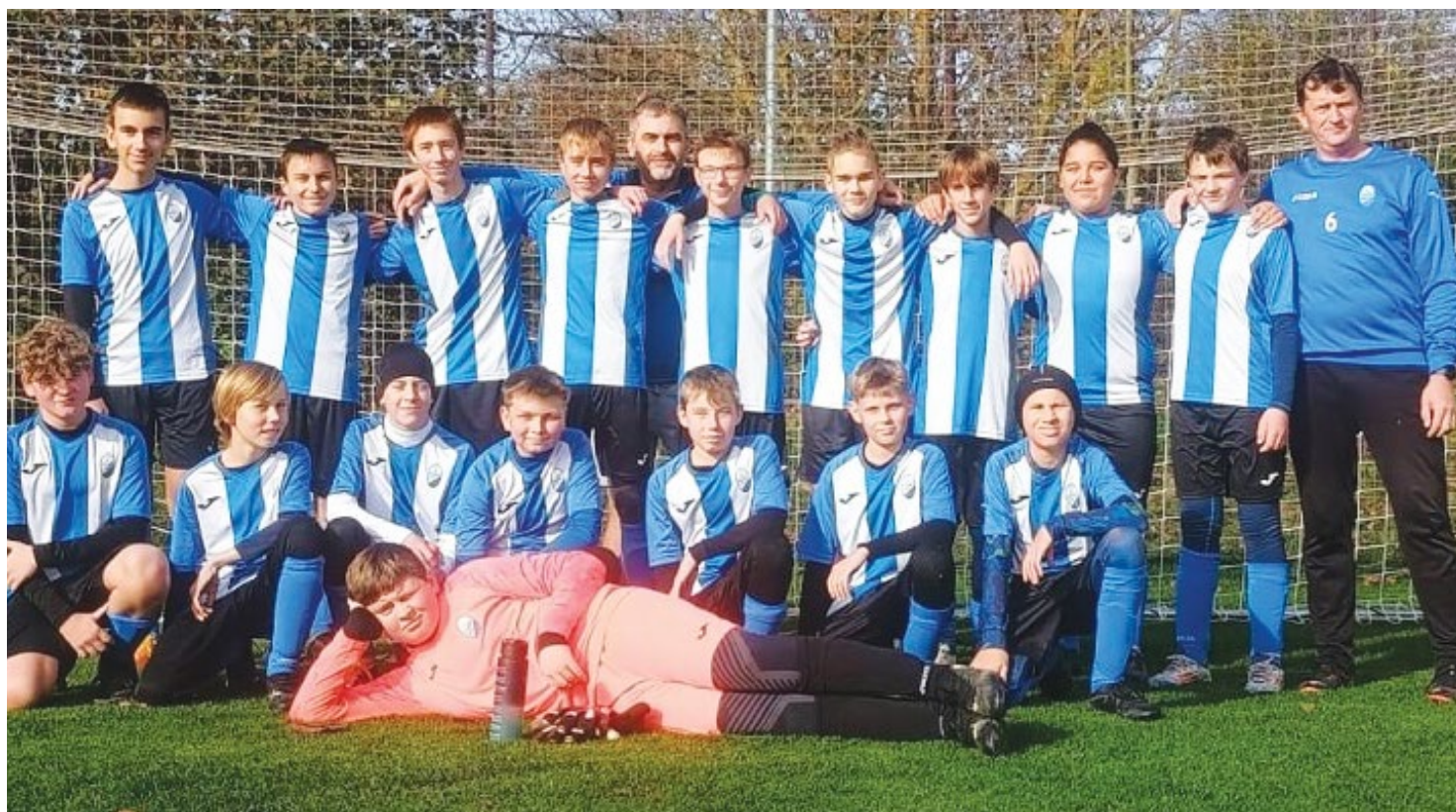
Starší žáci FC Hvozd