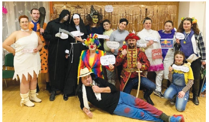
Maškarní ples – Klužíněk