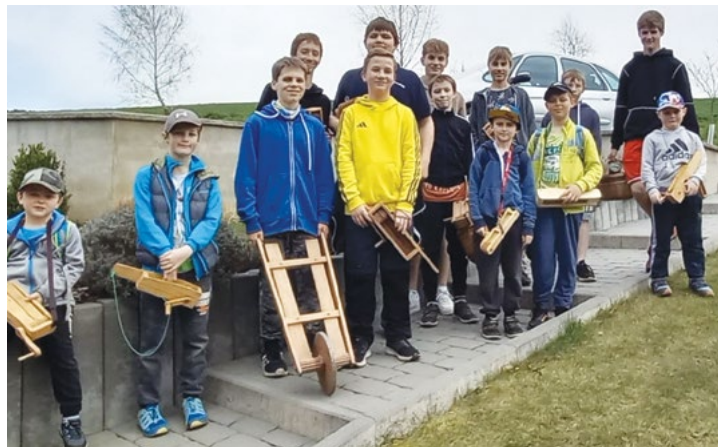
„Vrkači“ – Hvozd