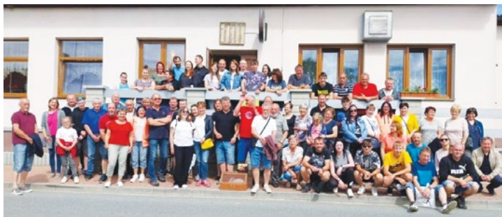
Návštěva ve Hvozďě u Plas