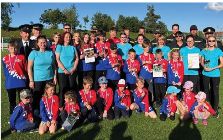
Hasiči Hvozd – okrskové cvičení