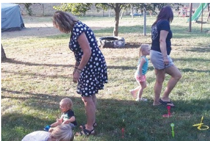
Rozloučení s prázdninami – Vojtěchov