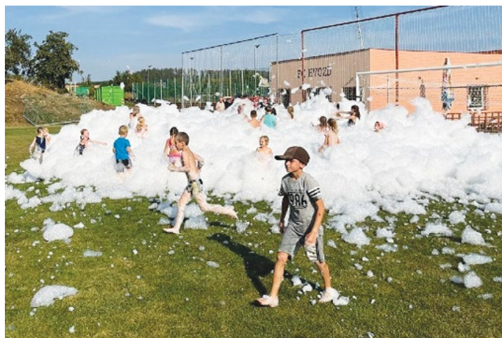
Rozloučení s prázdninami – Hvozd