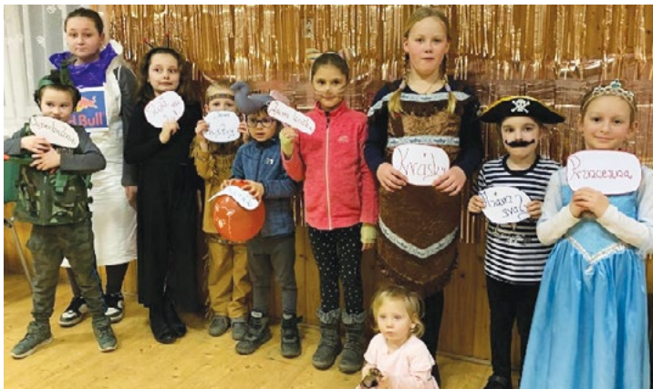
Maškarní ples – Klužíněk