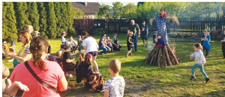
Pálení čarodějnic – Hvozd