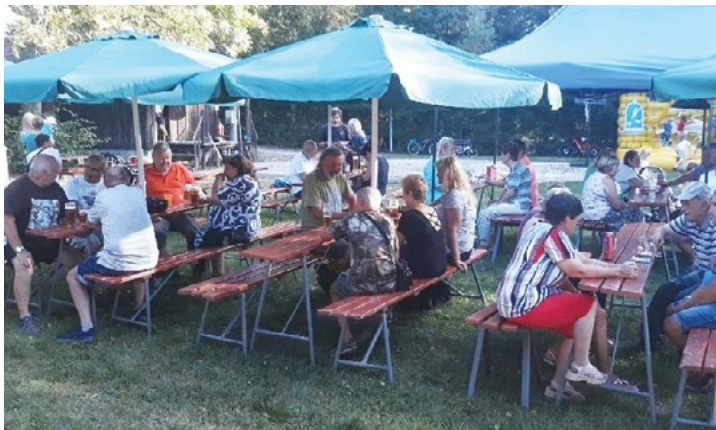
Rozloučení s prázdninami – Vojtěchov