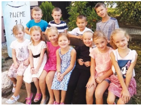
Žáci I. Třídy ZŠ Hvozď 2024

K tomu všemu, když si ještě připočteme studijní úspěchy (opět se žáci dostali na gymná-