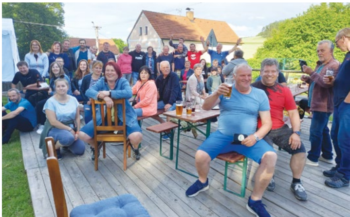
Návštěva ve Hvozďě u Plas