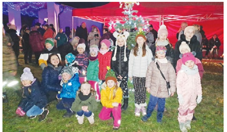
Rozsvícení vánočního stroměčku – Hvozd