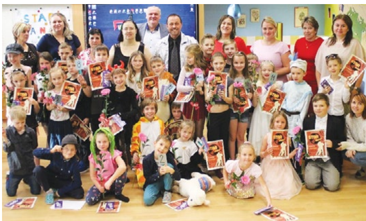
Star dance škola – Hvozd