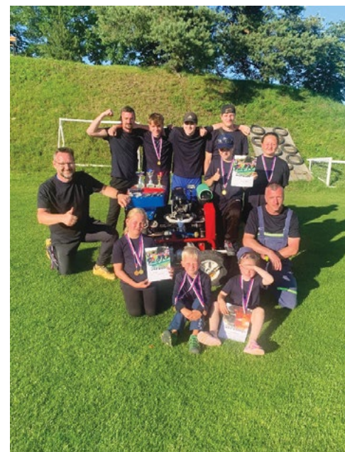
SDH Klužínek na okrskové soutěži

V prosinci nás čeká Mikuláš, který bude mít letos jiné místo a to před hasičskou zbrojnicí. Rozsvítíme stromeček, navštíví nás Mikuláš