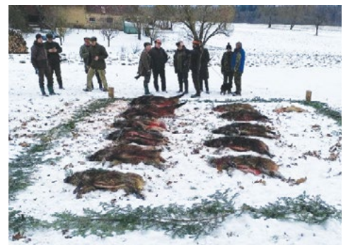
Naháňka – leden 2024