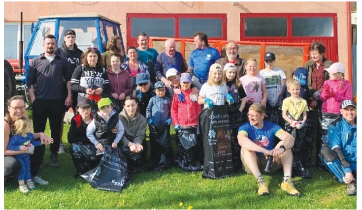
Uklidíme Česko – Klužíněk