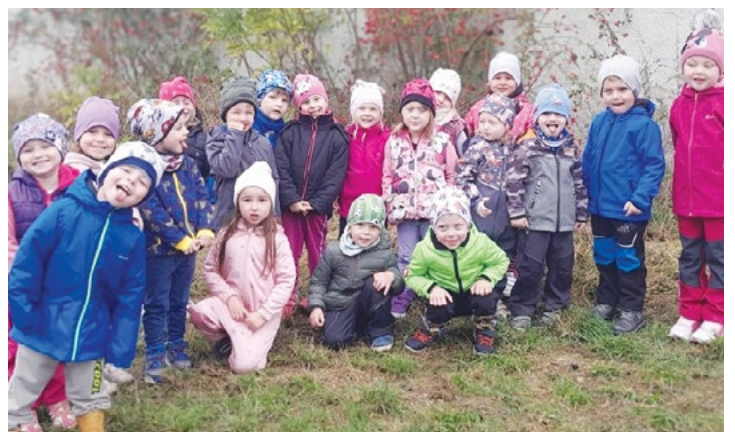
Žáci MŠ – Hvozd

Vydává obec Hvozd, nákladem 250 ks. Hvozd 90, Hvozd, 798 55. IČ: 00288306. Datum vydání: 11. 12. 2024