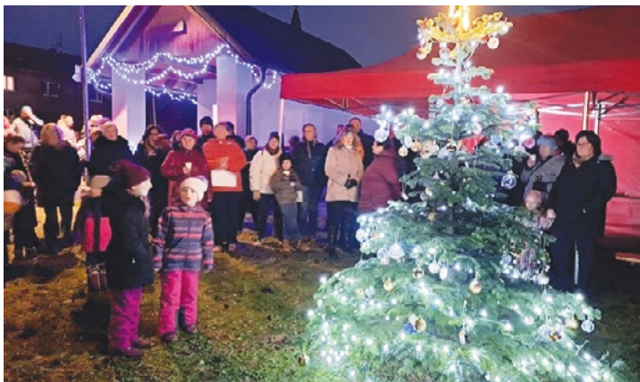
Rozsvícení vánočního stroměčku – Hvozd