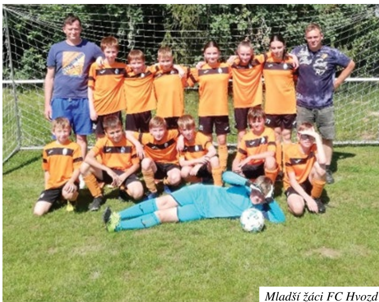
Mladší žáci FC Hvozd