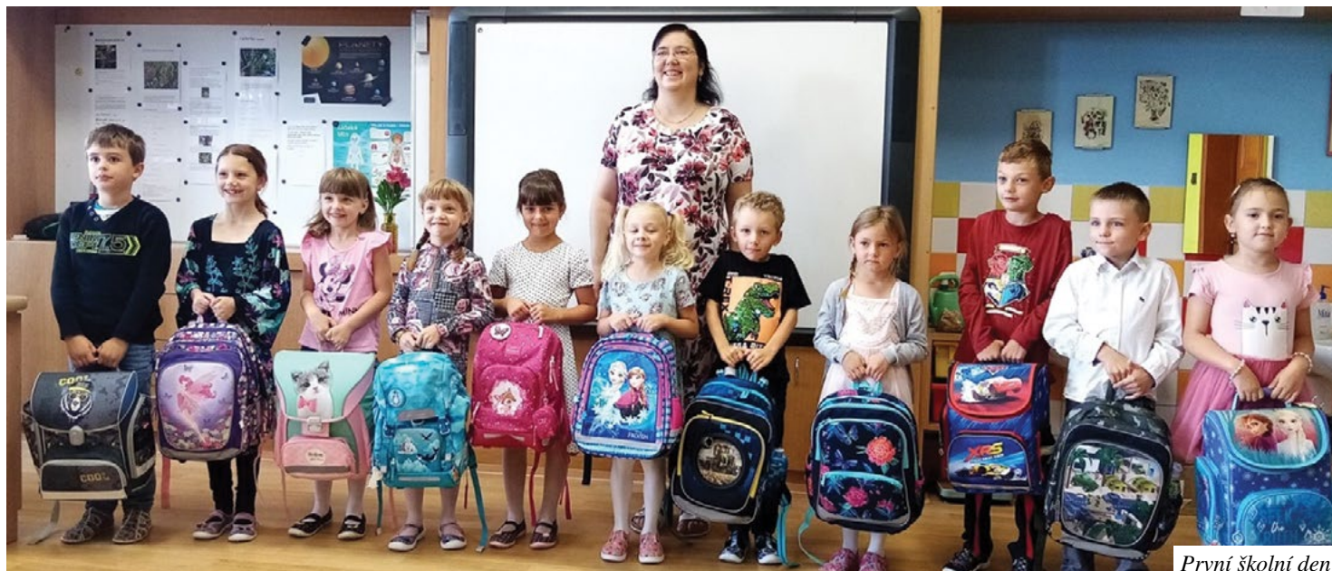
První školní den