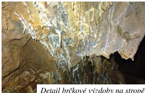
Detail brčkové výzdoby na stropě

ka jeskyně (i s odbočkami) již činí cca 70 m. Mohutnost závalu je ale příslibem dalších a jak doufáme již volných chodeb jeskynního systému. Nezbyvá než opět vybudovat lanovky na transport materiálu a pokračovat dále v objevování tajemství této zajímavé jeskyně.