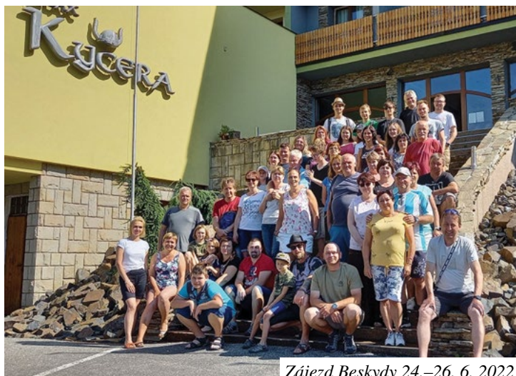
Zájezd Beskydy 24.–26. 6. 2022