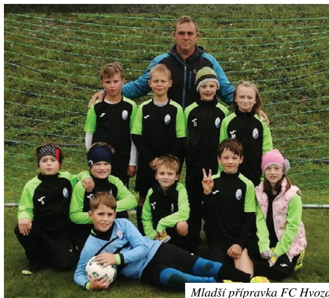
Mladší přípravka FC Hvozd