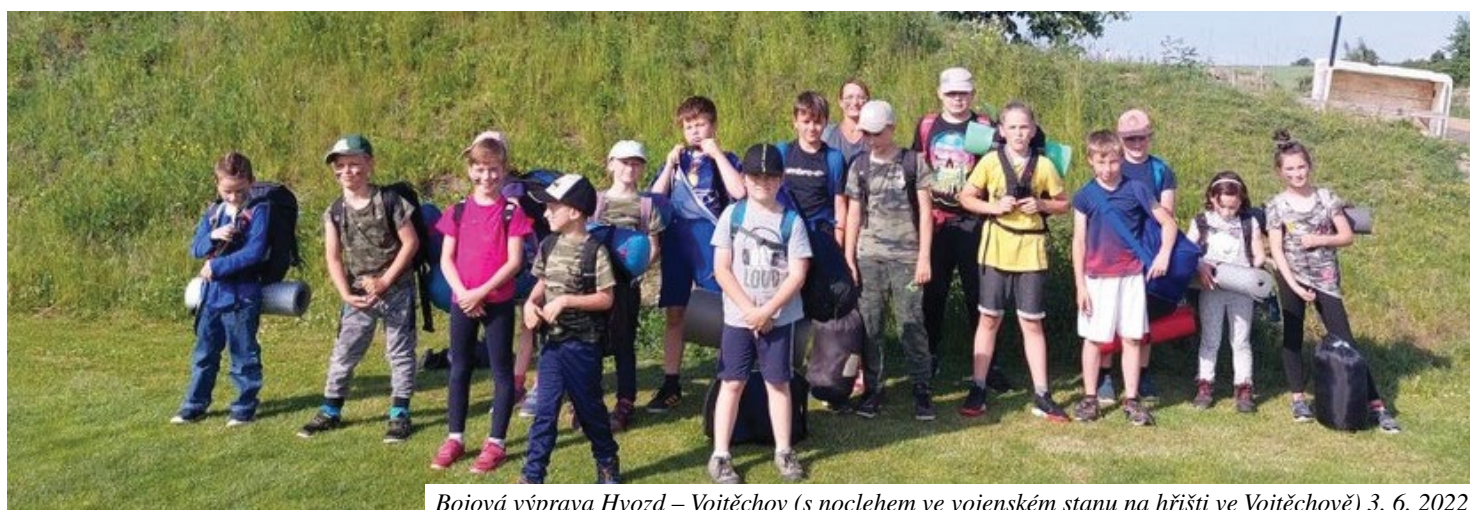
Bojová výprava Hvozď – Vojtěchov (s noclehem ve vojenském stanu na hřišti ve Vojtěchově) 3. 6. 2022