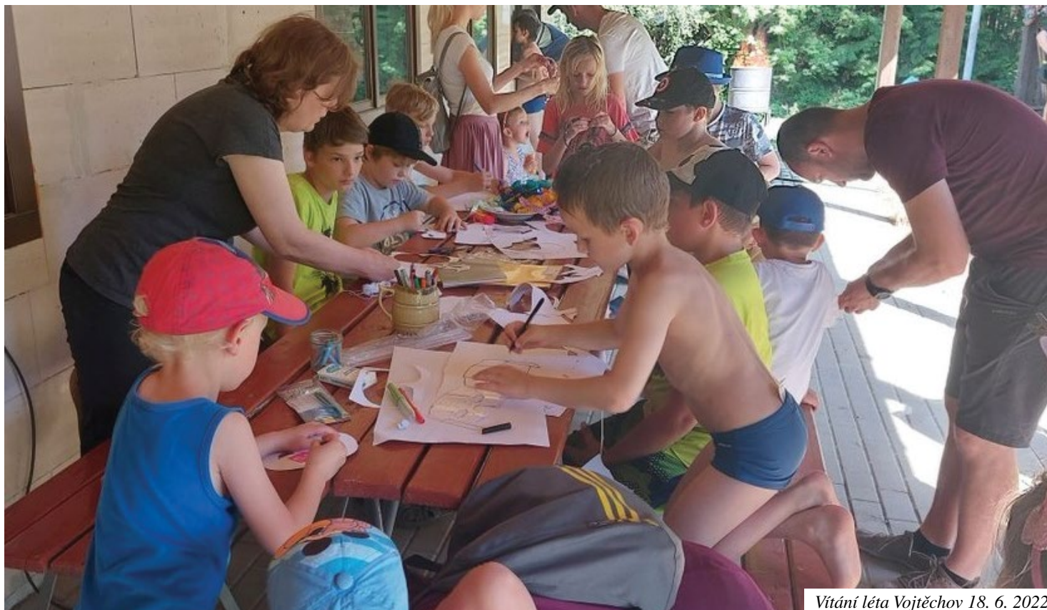
Vítání léta Vojtěchov 18. 6. 2022