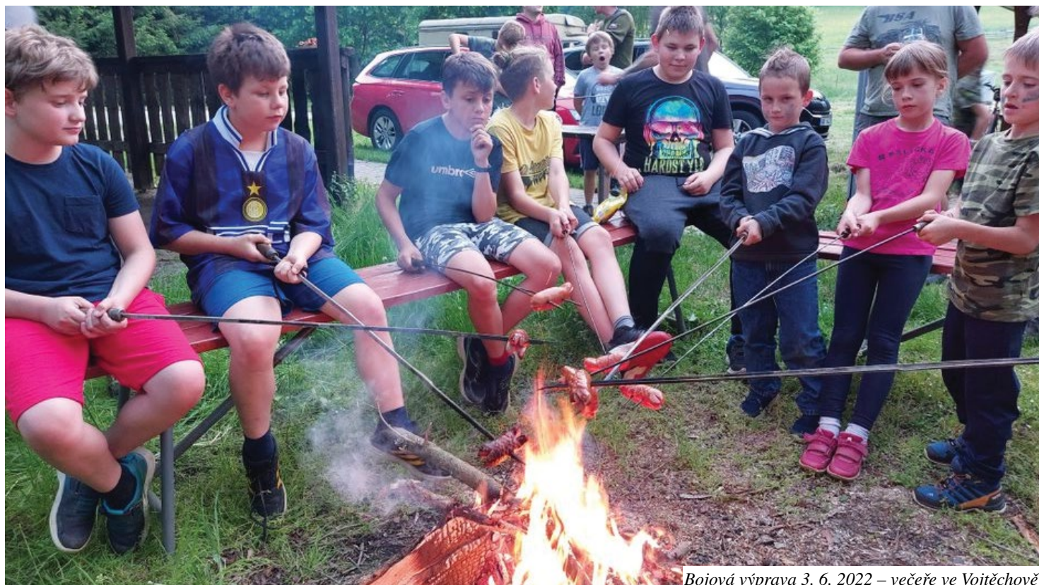
Bojová výprava 3. 6. 2022 – večeře ve Vojtěchově