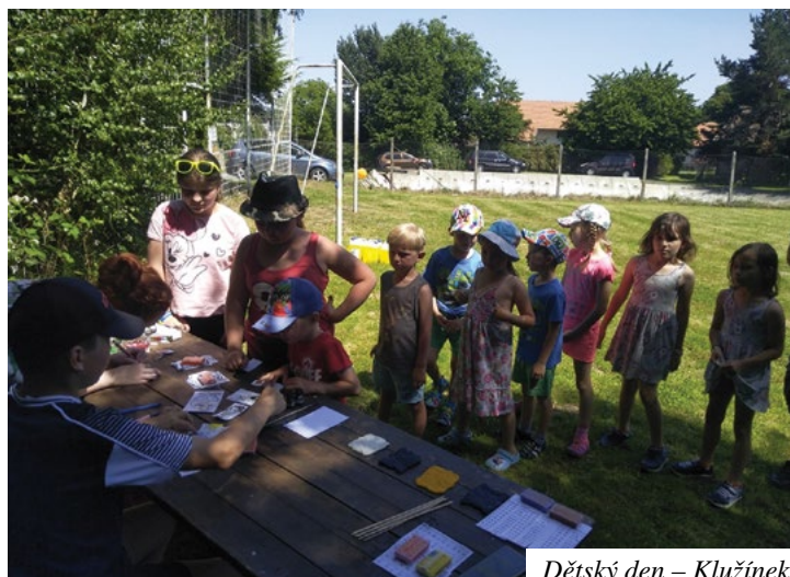
Dětský den – Klužínek