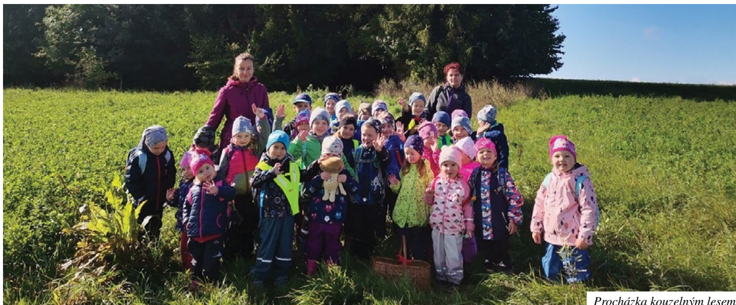
Procházka kouzelným lesem