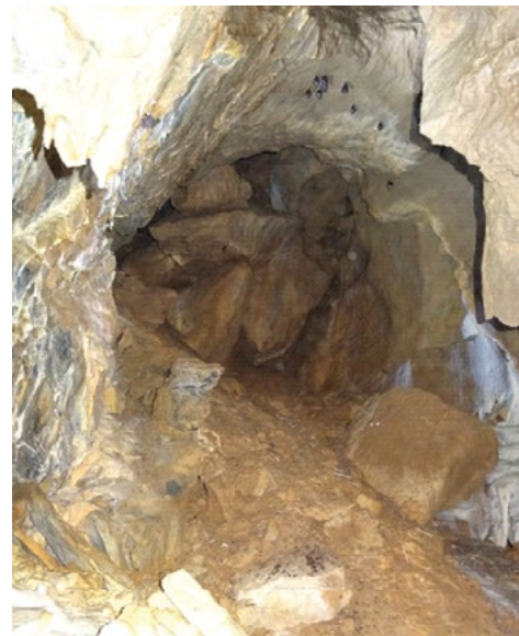
Nově objevená část jeskyně se závalem na konci