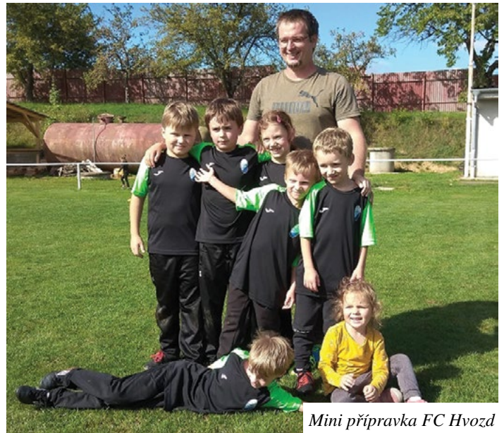
Mini příprava FC Hvozď

Spokojené vánoční svátky a v novém roce vše nejlepší přeje realizační tým FC Hvozď