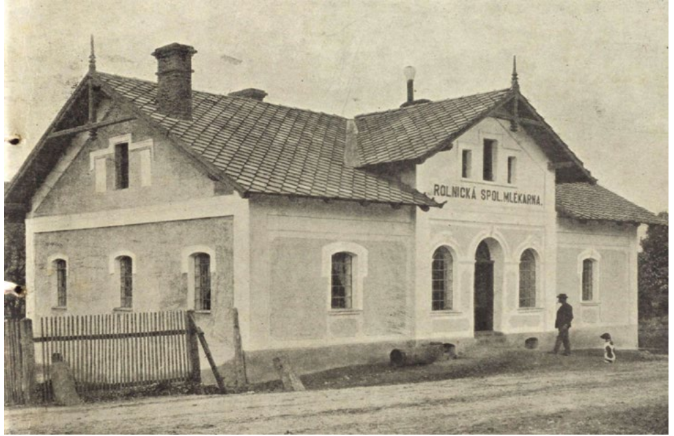
Budova mlékárny kolem roku 1902

V lednu roku 1902 byla po několikaletém úsilí uvedena do provozu rolnická mlékárna ve Hvozďe.